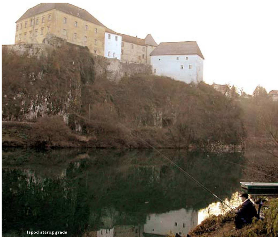
Ispod starog grada

plojki, većih klenova, deverika, a ponekad i podusta.