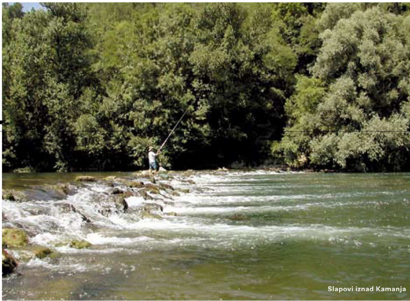
Slapovi iznad Kamanja