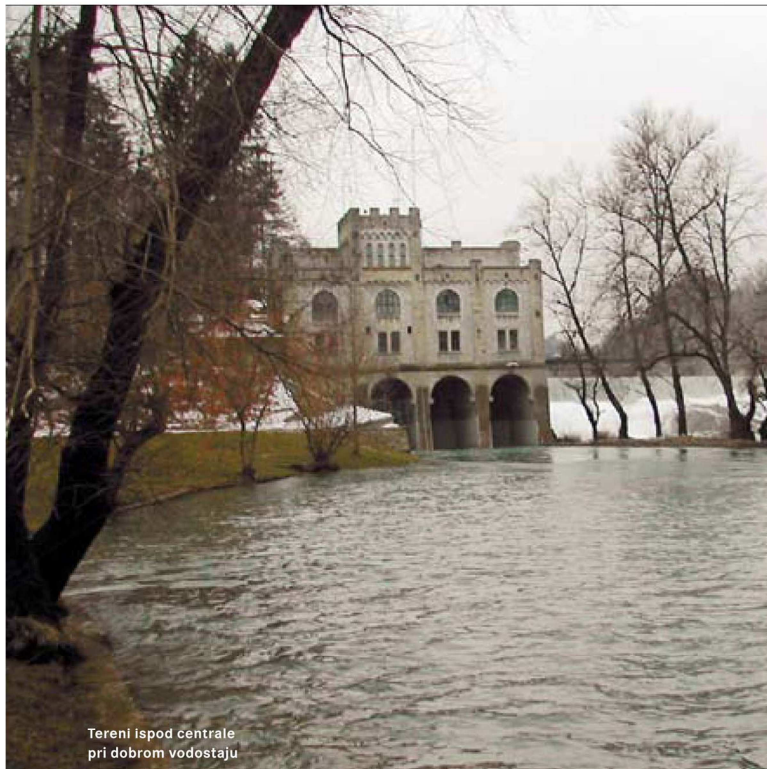
Tereni ispod centrale pri dobrom vodostaju