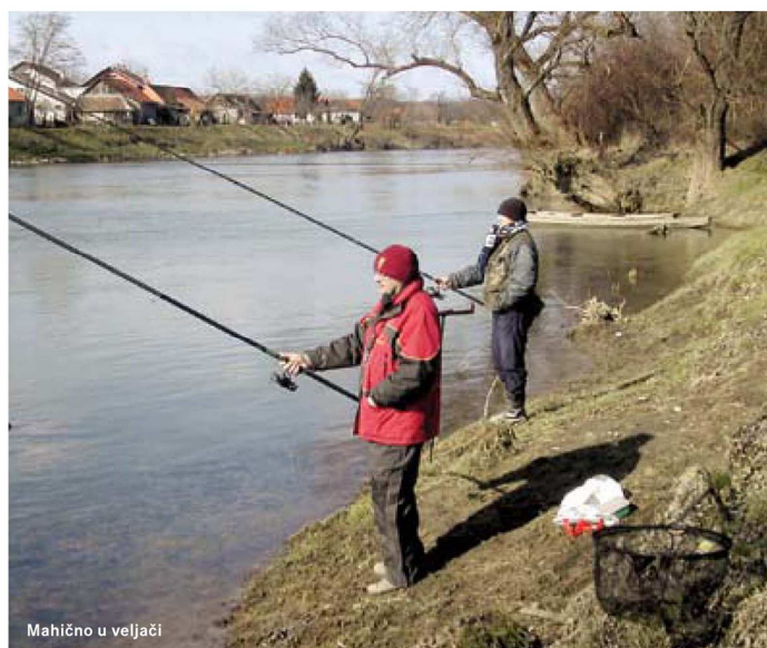
Mahično u veljači

Kupe, nalazi se mjesto koje svi koji tamo love zovu "kod šporeta". Za vrijeme visokih vodostaja, odmah iza granja, tu uvijek primaju manji ili osrednji podusti, a zna biti i lijepih plojki i šnajdera. Mamac je crv, ali može i tanja glista ili pahulja.