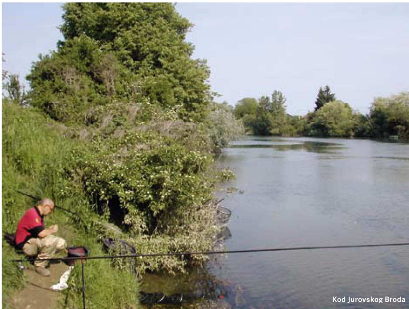
Kod Jurovskog Broda