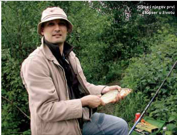
Kikee i njegov prvi štupser u životu

Bez toga ne idem na vodu - hrane River Feeder i Big Roach, plovci oblika bačvice, udice Gamakatsu LS 1090 N i najlon Browning Cenitan